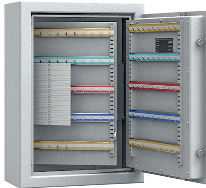
* Modell Subra 300