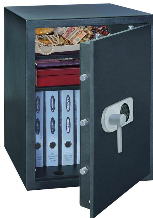
Samoa 65 mit Elektronikschloss

Batteriebetrieben (von innen einsetzbar); Notbestromung von aussen möglich bis Samoa 55 mit Klappgriff / ab Samoa 65 mit Handhebelgriff